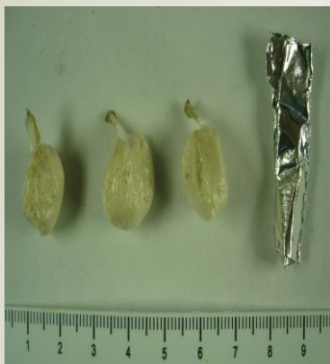
Наркотик в расфасованном виде (фольга, полиэтилен)