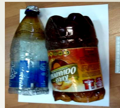
Самодельные приспособления для курения наркотических средств